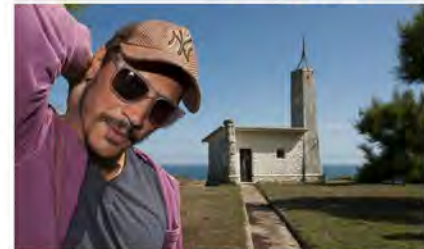
El actor y director Sergio Peris-Mencheta en la Península de La Magdalena.

17/08/2015 - 19:40h Compartir 13 Me gusta 13 Twitter 13