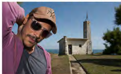
Ha sentido "mucho más la vocación de director que la de actor" porque la dirección le resulta "gozosa" y la actuación, "dolorosa"

Menú Inicio 2 Twitter 1 Google+ LinkedIn Digg